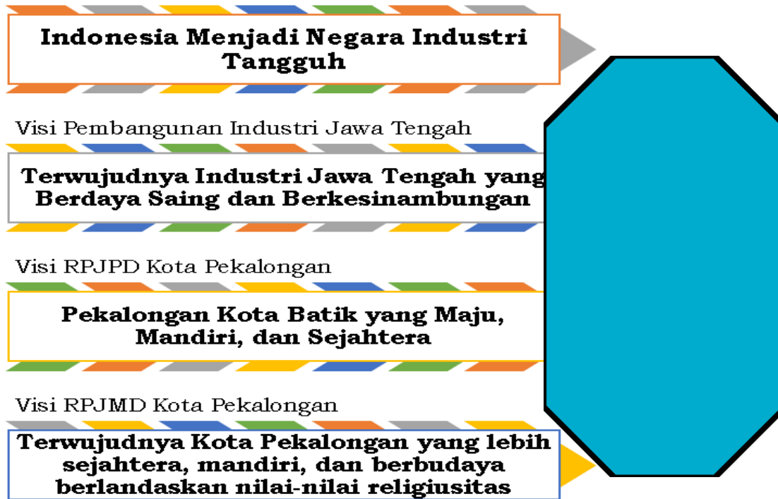
Gambar 3.1. Keterkaitan antara RPIN, RPIP Jawa Tengah, RPJPD, dan RPJMD Kota Pekalongan

Berdasarkan keterkaitan antara visi dan misi pembangunan industri nasional, visi dan misi pembangunan industri Provinsi Jawa Tengah, serta Visi dan Misi Pembangunan Daerah Kota Pekalongan, maka dapat dirumuskan bahwa Visi Pembangunan Industri Kota Pekalongan adalah “Terwujudnya Industri Kota Pekalongan yang Maju Berbasis Ekonomi Kreatif dan Kearifan Lokal” . Dalam visi tersebut setidaknya terdapat tiga kata kunci yaitu Maju, Ekonomi Kreatif, dan Kearifan Lokal. Penjelasan dari ketiga kata kunci tersebut dapat diuraikan sebagai berikut: